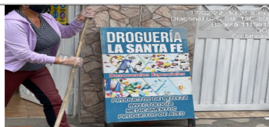
Foto No. 4 El establecimiento de comercio DROGUERÍA LA SANTA FE cuenta con un elemento de publicidad no regulado, instalado en área que constituye espacio público, ubicado sobre la Diagonal 62 C costado suroriental, con texto publicitario: "droguería la santa fe + imagen + descuentos especiales + imagen + productos de belleza + inyectología + medicamentos + productos de aseo".