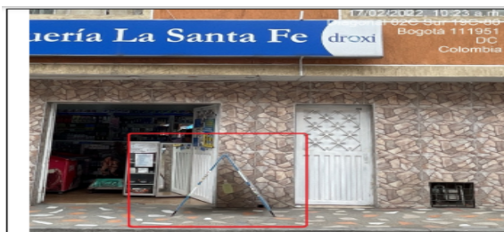
Foto No. 3 El establecimiento de comercio DROGUERÍA LA SANTA FE cuenta con un elemento de publicidad no regulado, instalado en área que constituye espacio público, ubicado sobre la Diagonal 62 C costado suroriental.