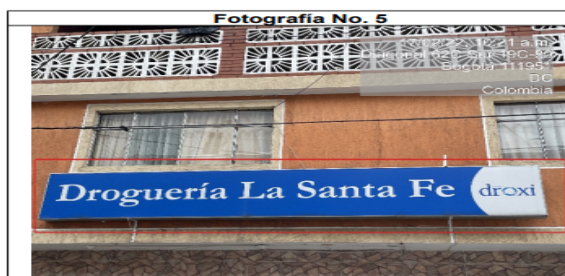
Foto No. 5 El establecimiento de comercio DROGUERÍA LA SANTA FE cuenta con un aviso el cual esta volado de la fachada.