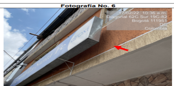
Foto No. 6 Se evidencia un aviso el cual se encuentra volado de la fachada.